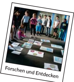
Forschen und Entdecken