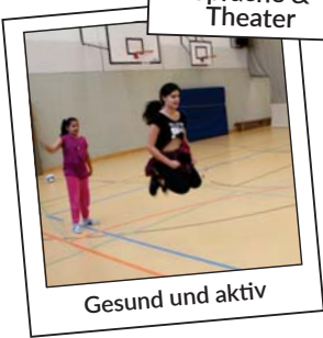
Gesund und aktiv